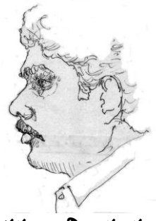
సేకరణ : విజయానంద్ జి