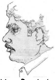
సేకరణ : విజయానంద్ జి

శిష్యుడు:- సాక్షాత్కారం అనేది క్రమంగా (Gradual) కలుగుతుందా?